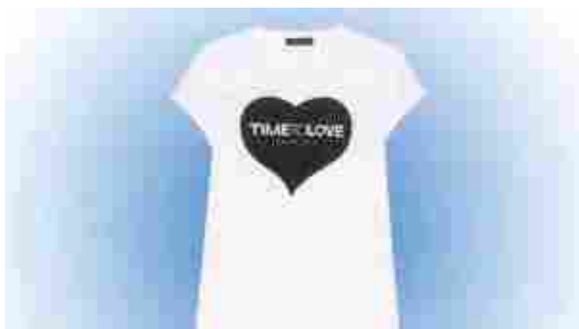
Twin Set lancia Time to Love, la t-shirt in limited edition dall'anima charity

Moda e solidarietà si incontrano e danno forma a edizioni speciali. Twin Set lancia una t-shirt in limited edition dall'anima charity.