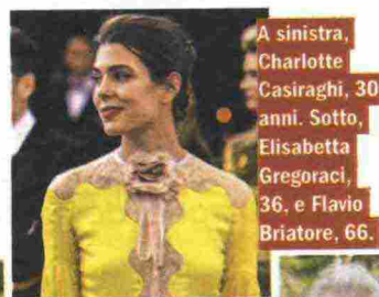
A sinistra, Charlotte Casiraghi, 30 anni. Sotto, Elisabetta Gregoraci, 36, e Flavio Briatore, 66.