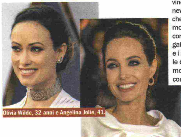
Olivia Wilde, 32 anni e Angelina Jolie, 41.