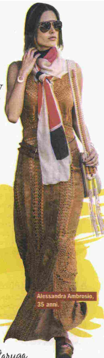
Alessandra Ambrosio, 35 anni.

La top model brasiliana Alessandra Ambrosio cambia stile di continuo. Un giorno è super casual, quello dopo iperfemminile. In questa foto, sfoggia un look country: lungo abito effetto daino, cintura in vita e borsa con frange. Il tocco chic? L'elegante sciarpa colorata legata al collo. Da copiare.