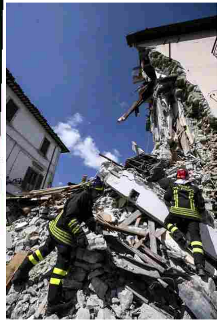
Continua lo sciame sismico: la scossa più forte, di magnitudo 4,5, alle 5 e 17